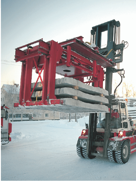
Hydraulitoiminen 9 tonnin trukkitarrain betonisten ratapölkkyjen lastauksessa