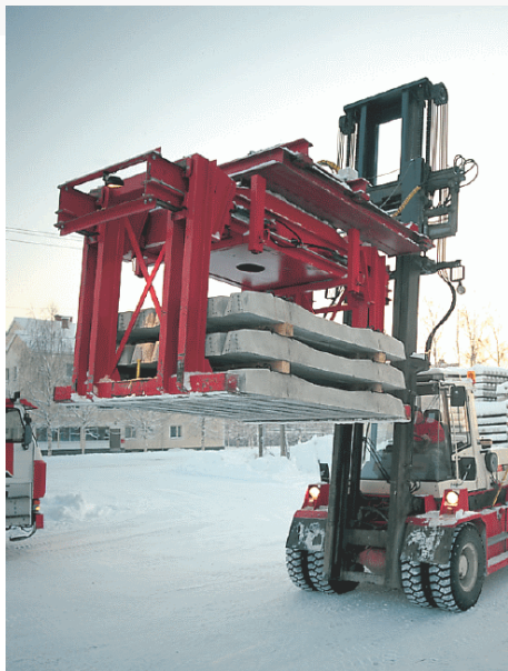
Hydraulitoiminen 9 tonnin trukkitarrain betonisten ratapölkkyjen lastauksessa