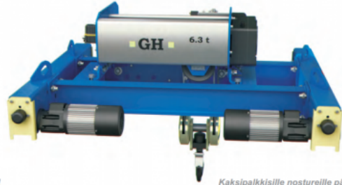
Kaksipalkkisille nostureille päätytelä