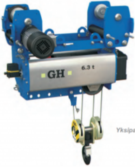
Yksipalkkisille nostureille ja 1-kiskoradoille